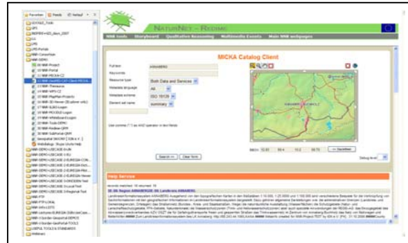
Regional SEARCH of MetaInfo using NUTS classification of EUROSTAT Multilingual description of geodata services for "Landkreis ANNABERG"