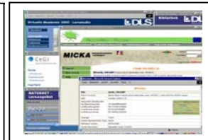
NNR-Tools-Integration at VSBI (MTL) Virtual e-Learning-Academy2000 (DLS)